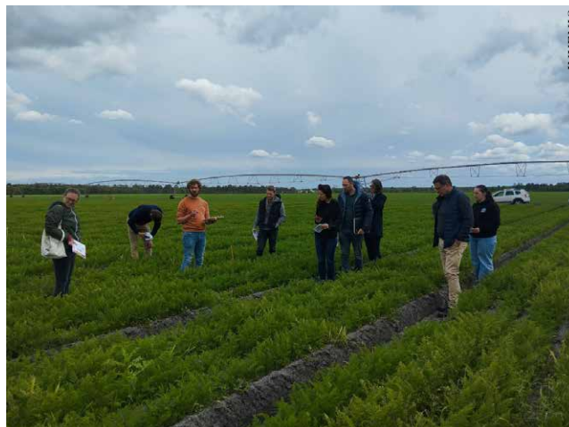
Visite des essais MiFaSol

A près deux campagnes d'épandage de matières organiques de différentes natures (compost, fumier, digestat de méthaniseur et BRF), à différentes doses, les cultures révélatrices de carottes primeurs ont été semées début d'année 2024. L'étude des rendements et de l'impact de ces amendements sur la qualité de la récolte (Nombre et poids de carottes courtes, carottes fourchues et carottes malades), permettra d'évaluer le potentiel de restauration de la vie du sol de ces différentes matières organiques. Les résultats permettront ainsi de piloter l'apport de ces amendements organiques dans la rotation, dans un objectif de redynamisation de la