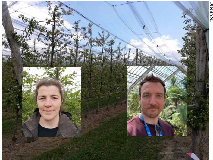
L'expérimentation pomme se poursuit avec un nouveau binôme d'expérimentateurs

Pour plus d'informations, Sara Pinczon du Sel Groupe Arboriculture s.pinczon@invenio-fl.fr