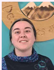
FRUITS ROUGES MONTS VELAY

à la clef : comment peut-on favoriser cette initiation florale ? Quelles sont les conditions à avoir au moment de l'initiation florale pour optimiser la production ? »