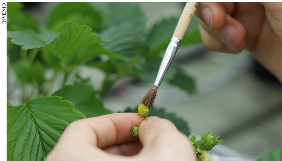
Pollinisation d'une fleur castrée en déposant du pollen au pinceau

Afin de s'assurer d'une pollinisation croisée et dirigée où le choix de la plante mâle et de la plante femelle est contrôlé, nous effectuons cette étape entièrement à la main, de la récolte du pollen à de la castration et pollinisation au pinceau de la fleur et enfin à la récolte des graines. L'obtention d'une graine peut donc nécessiter plusieurs heures de travail. Elle demande de la dextérité et doit être réalisée sur la période restreinte de la floraison, il est donc essentiel que cette étape soit la plus efficace possible car ce sont plusieurs milliers de fleurs qui sont manipulées par an.