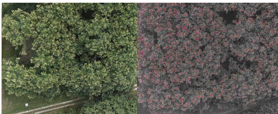
Illustration d'une prise de vue par le drone puis traitement d'image par le LaBRI, mise en évidence des bogues en rouge puis dénombrement

Alors Nathalie, elle s'annonce comment la récolte cette année ?? Que ce soit au téléphone ou dans les couloirs d'Invenio cette question revient chaque été. L'expertise et l'expérience sont de bons alliés mais ils sont vite insuffisants pour avoir des données précises et fiables. Actuellement l'estimation de la récolte reste relativement...subjective. Peu de producteurs se lancent dans des estimations au-delà d'une appréciation qui ressemblent bien souvent à un « ça a l'air moins bien que l'an dernier » ou « la pollinisation s'est bien passée, les bogues sont bien remplis ». Et même en voulant être le plus précis possible, aujourd'hui, nous n'arrivons qu'à une estimation partielle qui ne nous permet que de comparer le potentiel de production de l'année aux récoltes réalisées les années précédentes. Nous suivons deux composantes importantes du rendement pour lesquelles nous procédons à des comptages en parcelle. Le taux de remplissage (nombre de fruits/bogues) et la charge (nombre de bogues/m 2 ). Il suffirait de tout ramener à une surface totale du feuillage et un poids moyen de chaque fruit, facile non ? Mais les mesures de ces variables s'avèrent très vite complexes de par le volume des arbres !