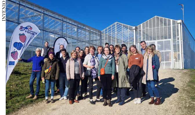
Délégation devant la serre verre lors de la visite à Douville

L e 13 mars dernier, une trentaine de personnes venues de toute l'Europe se sont retrouvées à Douville dans le cadre d'un atelier de deux jours sur le thème des « outils de la génomique pour le pré-breeding des petits fruits », organisé en marge d'un projet Européen. Cette visite a été l'occasion d'échanges très fructueux autour de la fraise, de la framboise et de la myrtille. Cette opportunité qui nous a été faite de présenter notre programme de sélection ainsi que présenter nos essais en expérimentations, confirme le rayonnement des travaux d'Invenio au niveau européen. Nous sommes reconnus à la fois comme obtenteur et expérimentateur. De nouvelles