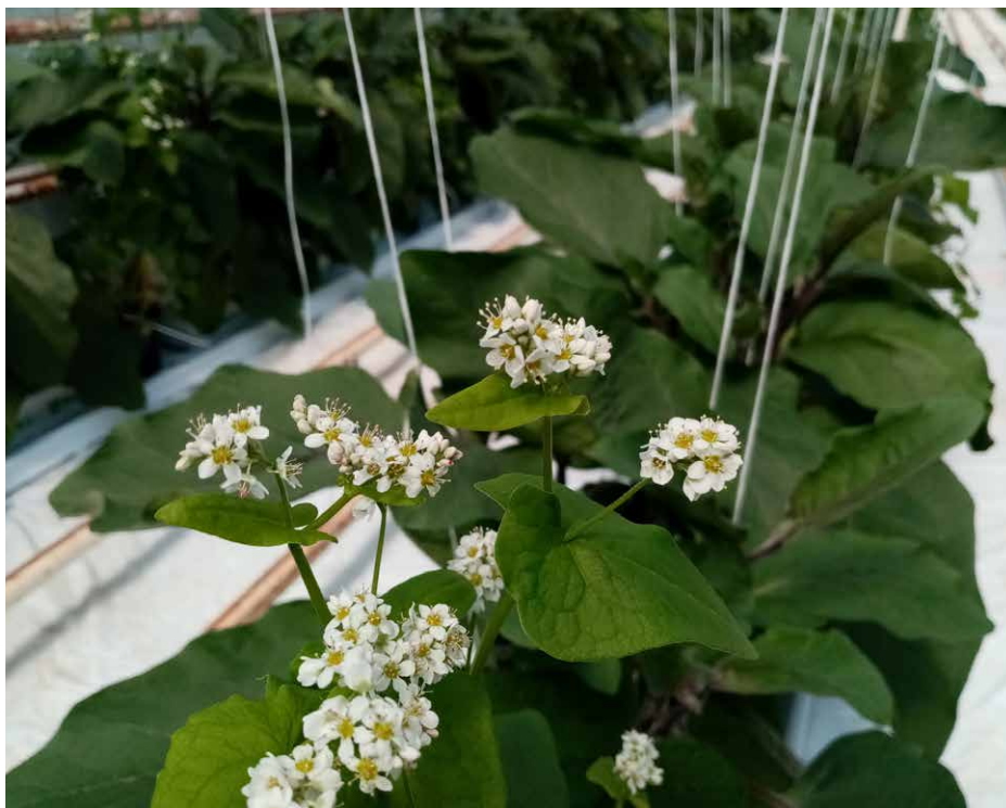
Plant de sarrasin en fleurs dans un compartiment d'aubergine

La punaise verte, Nezara viridula a un impact très important sur les cultures d'aubergine de la région Nouvelle-Aquitaine. En effet, les dégâts provoqués par ce ravageur peuvent atteindre jusqu'à 40% de pertes sur la production totale. À ce jour, il n'existe pas de solutions efficaces respectueuses de l'environnement et de la faune auxiliaire qui permettent de contrôler les populations. Une des solutions possibles pourrait être l'apport de l'insecte parasitoïde des œufs de Nezara viridula , Trissolcus basalis . Malgré des essais concluants en laboratoire, l'utilisation de cette méthode n'a pas encore montré tout son potentiel sous serre de production. En effet, de 2020 à 2023, des lâchers de Trissolcus basalis ont été réalisés dans les compartiments d'aubergine hors-sol du site Invenio de Sainte Livrade sur Lot. Dans chaque situation, les populations et les dégâts n'ont pu être empêchés et jusqu'à 10 % de perte de ren-