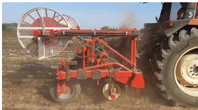
Concept Rafu en test sur culture de fraise AB

Rafu est régulièrement au cœur de l'actualité du pôle machinisme. Ce travail a commencé avec la mise au point d'une machine de nettoyage et de récupération des plastiques de forçage utilisés en cultures de carottes. La technologie a été dupliquée pour les paillages de cultures de melon ou de salade (voir numéros précédents). S'ils n'ont plus besoin de démontrer leur intérêt agronomique, surtout dans un contexte de suppression de solutions herbicides, les plastiques agricoles ne peuvent être une solution pour une