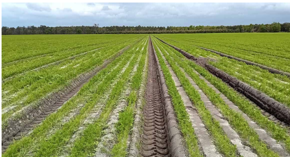
AlterCarot : Différence d'enherbement de la carotte primeur 2024 au débâchage. A gauche SdC Référence (PSPL classique + Plastique 500 trous). A droite SdC AlterCarot (PSPL allégé + Plastique ProtechBio transparent et noir)

Depuis le début du projet, les baisses d'IFT sont encourageantes mais inégales selon le SdC considéré. Ainsi, les diminutions s'échelonnent de -38% à -64% en fonction des systèmes. Ces résultats sont le reflet d'une prise de risque modérée, les essais étant menés sur des parcelles de produc-