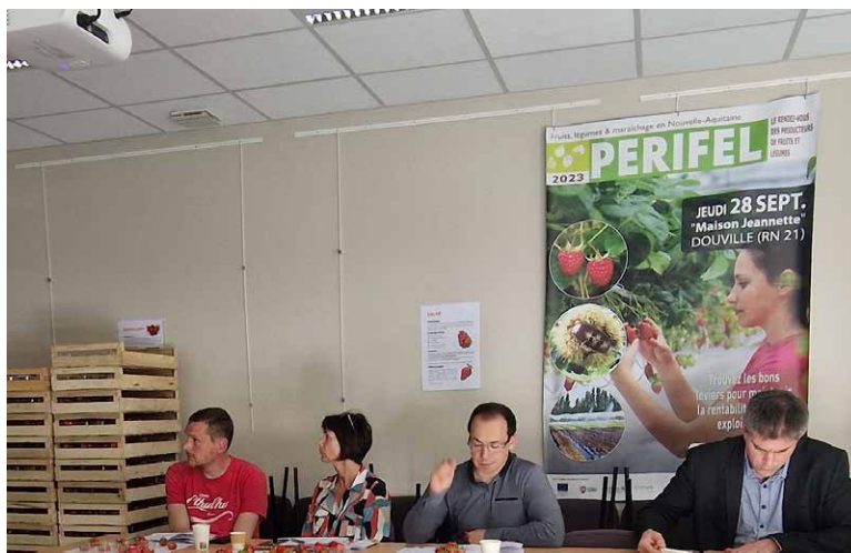
Les adhérents sont au cœur des orientations pour l'avenir des travaux de notre association