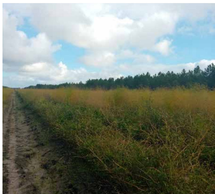
Parcelle d'asperges fortement enherbée sur le rang à l'automne

Pour plus d'informations, Maurane Pagniez Pôle Asperge m.pagniez@invenio-fl.fr