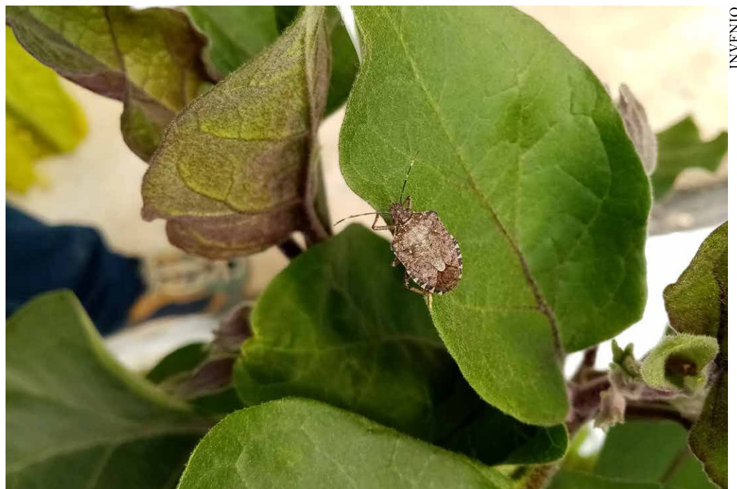
Adulte d' Halyomorpha halys sur feuille d'aubergine

Pour plus d'informations, Maxime Ménard Pôle Aubergine Poivron m.menard@invenio-fl.fr