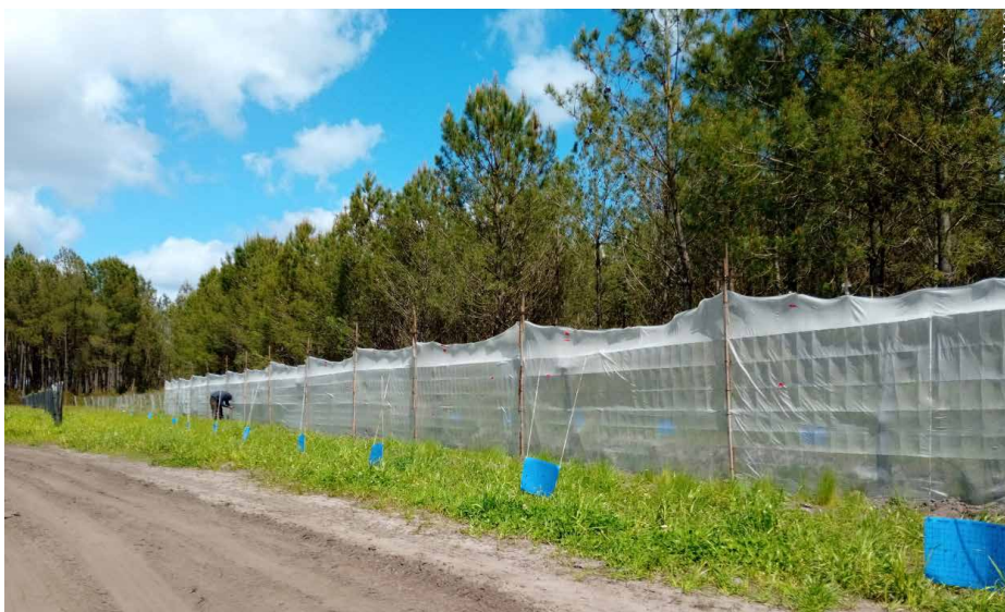
Evaluation d'un dispositif de filet en 2024 pour limiter la migration des criocères des forêts de pins vers les parcelles d'asperges.

« Initialement, nous possédons 40 ha d'asperges en AB. En raison d'une mauvaise gestion des criocères, les rendements sont faibles (1,8 t/ha pour les plus bas) et ne suffisent pas à couvrir les charges malgré des prix de vente corrects. Les produits autorisés en AB sont peu efficaces, les conditions d'application souvent contraignantes, les alternatives au chimique limitées. Nous avons donc choisi de convertir une partie des asperges en conventionnel pour mieux contrôler les criocères avec des