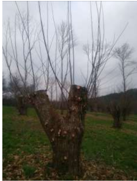
Après l'éclaircissage des rejets

Sujet rabattu en 2015 – 25 à 30 mn pour l'éclaircissage des rejets 3 ans après l'intervention