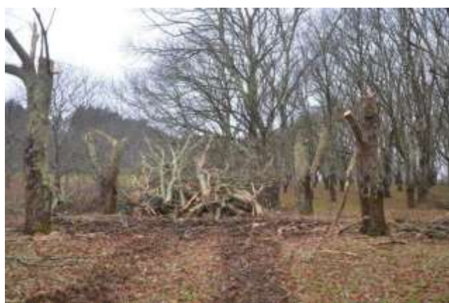
Verger après « couronnage total » des arbres

Pour la finition du chantier un passage de broyeur de type forestier peut être rajouté pour un coût d'intervention qui s'élève à 250 € / ha.