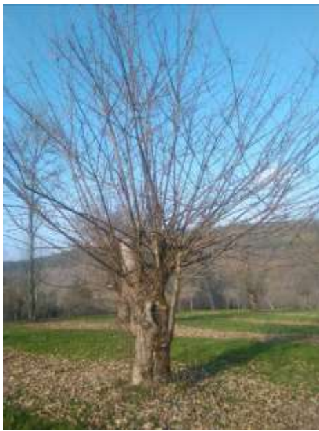
Avant l'éclaircissage des rejets

Sujet rabattu en 2015 – 25 à 30 mn pour l'éclaircissage des rejets 3 ans après l'intervention