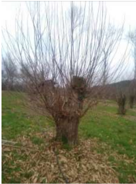
Avant l'éclaircissage des rejets