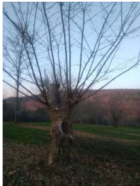
Après l'éclaircissage des rejets