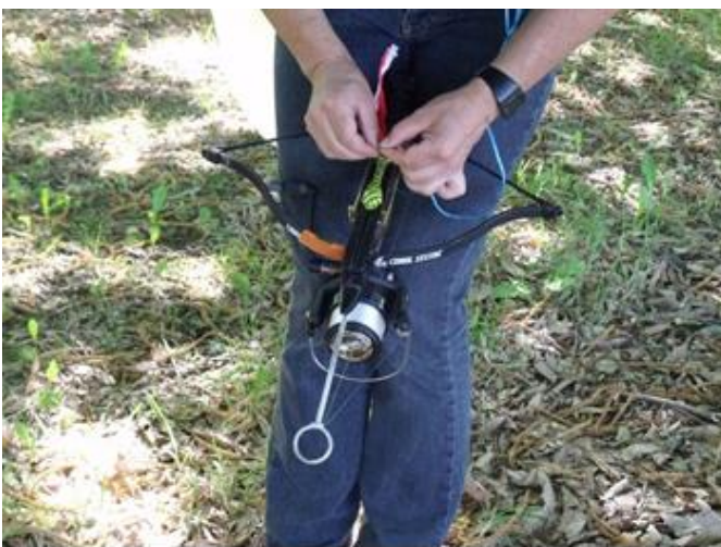
Arbalète adaptée d'un moulinet et d'un guide fil

Un système de pose à l'arbalète a été imaginé pour atteindre l'objectif du 1/3 supérieur.