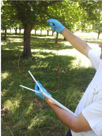
Diffuseur GINKO « RING » équivalent à 5 diffuseurs GINKO classiques

La hauteur des arbres sur cette parcelle est proche de 10 m. La pose dans le tiers supérieur des arbres est réalisable à l'aide d'une canne télescopique munie d'un embout adapté aux diffuseurs.