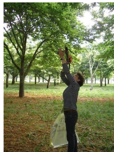
Tir dans le sommet de l'arbre