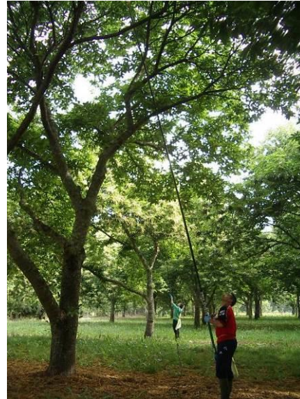
Pose à l'aide d'une canne télescopique dans le tiers supérieur des arbres