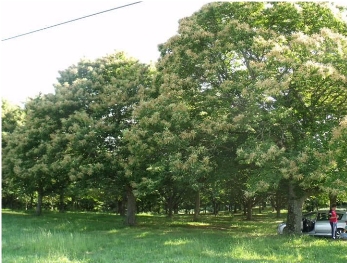
Site – 2 Troche (19) « Arbres de grands volumes » > à 12 m