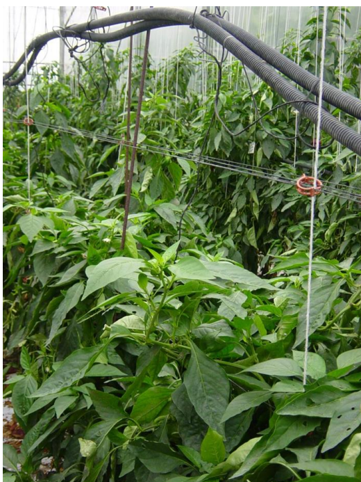
Palissage avec ficelles horizontales