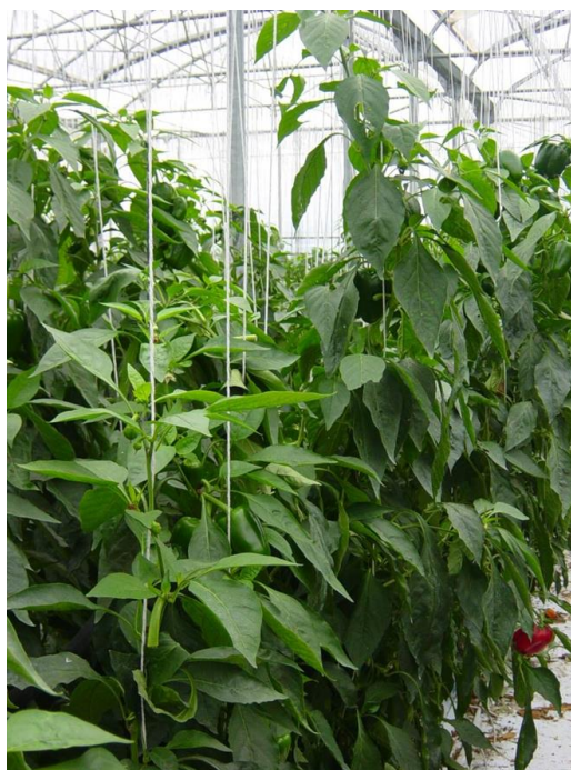
Palissage avec ficelles verticales