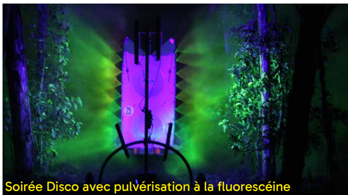
Soirée Disco avec pulvérisation à la fluorescéine

Si le choix du produit est important, la qualité de l'application, elle, est vitale. Ainsi, Invenio a été partenaire du projet national Pulvarbo sur la caractérisation de la pulvérisation de différents outils, ainsi que sur le travail des applications en fonction du volume des arbres au cours de la saison. Invenio a également travaillé sur la pulvérisation sur frondaison, et la démonstration de la qualité de pulvérisation de différents outils visant à réduire la dérive et/ou permettre les applications 1 rang sur 2.