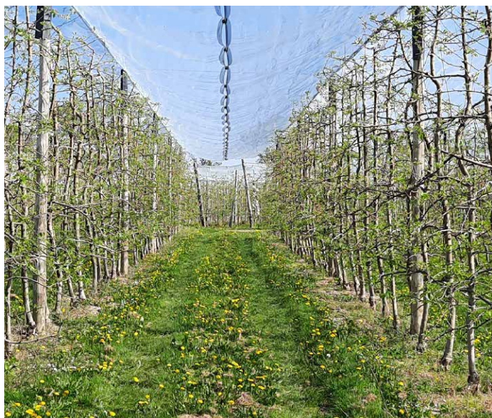
Filet paragrêle type autrichien

Deux systèmes sont les plus utilisés : le système autrichien qui utilise une forte pente de filet, ou le système V5, qui combine la faible pente du système élastique et la décharge centrale du système autrichien. (100% des vergers couverts).