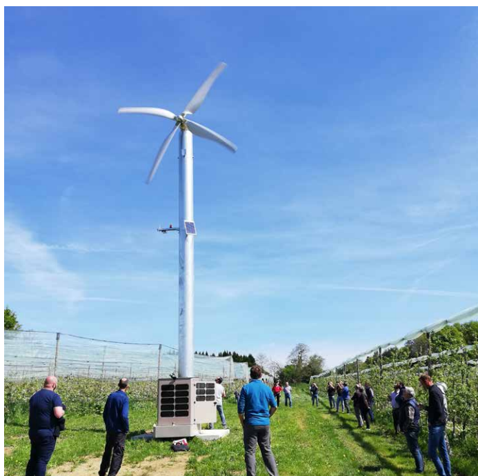
Vergers protégés par tour à vent chauffée

L' irrigation est également primordiale pour assurer une production régulière et de qualité. En Limousin, le cahier des charges de l'AOP limite les apports d'eau à la juste quantité au moment du grossissement du fruit, dans le but de soutenir la plante et de conserver la qualité des fruits. L'irrigation se fait en goutte à goutte pour une meilleure gestion de la ressource en eau. (67% des vergers couverts).