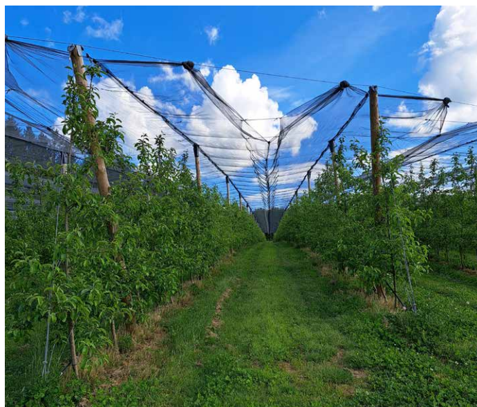
Filet paragrêle type V5

L' irrigation est également primordiale pour assurer une production régulière et de qualité. En Limousin, le cahier des charges de l'AOP limite les apports d'eau à la juste quantité au moment du grossissement du fruit, dans le but de soutenir la plante et de conserver la qualité des fruits. L'irrigation se fait en goutte à goutte pour une meilleure gestion de la ressource en eau. (67% des vergers couverts).