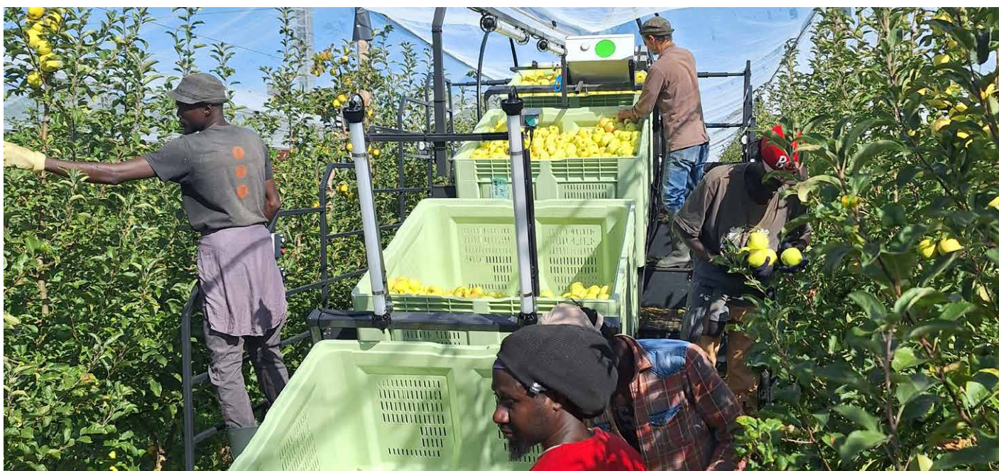
Cueillette manuelle avec assistance

Enfin, la récolte est, elle aussi, manuelle. Après tant de soin toute la saison, la délicatesse et la rapidité de la main humaine sont nécessaires pour garantir un beau fruit, sans mâchure et un travail efficace. Ces qualités n'ont pas encore été égalées par les machines. Il existe cependant des machines d'assistance, permettant de soulager le salarié et ainsi le laisser se concentrer sur sa mission première : cueillir avec délicatesse le fruit d'une année de travail.