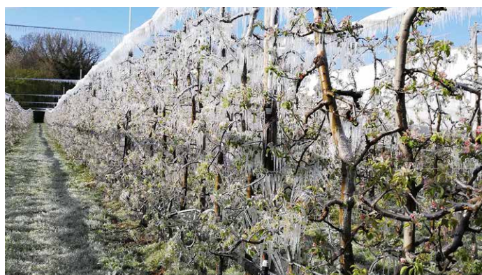
Vergers protégés par aspersion sur frondaison

Plusieurs systèmes sont en place : la lutte par aspersion d'eau sur frondaison, les tours à vent ou les systèmes de chauffage (bougies...). (20% des vergers couverts)