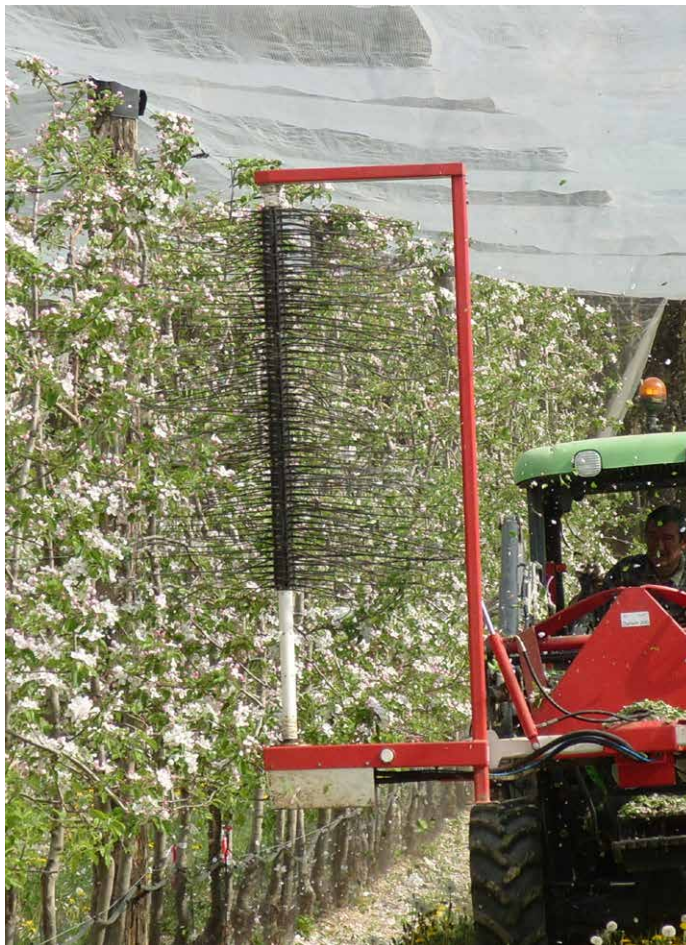
Eclaircissage sur fleur à l'aide de Darwin