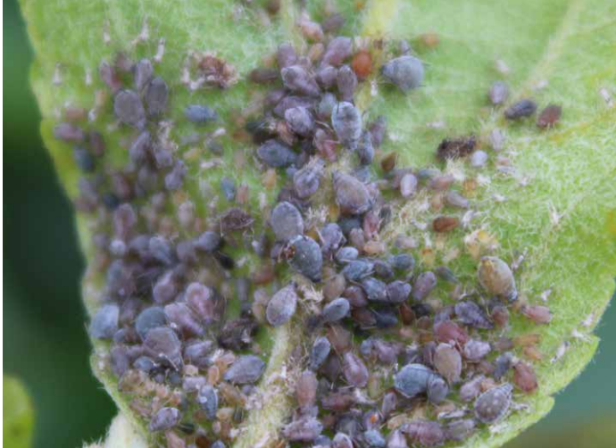
Colonie de pucerons cendrés sur feuille

Devenu ennemi n°1 de la culture depuis quelques années du fait de la disparition d'un grand nombre de solutions efficaces, c'est un insecte piqueur suceur qui déforme feuilles et fruits. L'enroulement des feuilles limite la photosynthèse et la piqûre sur fruit déforme ce dernier, le rendant non conforme aux standards de commercialisation comme pomme de table.