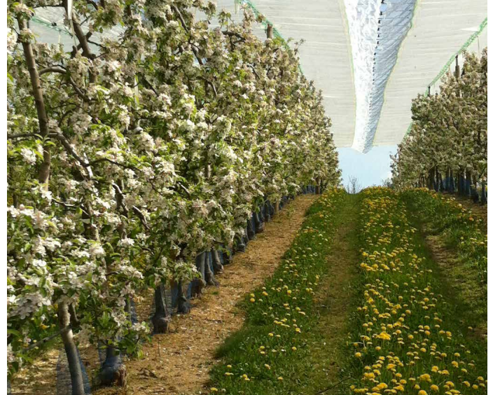
Bâche anti-pluie sur jeune verger