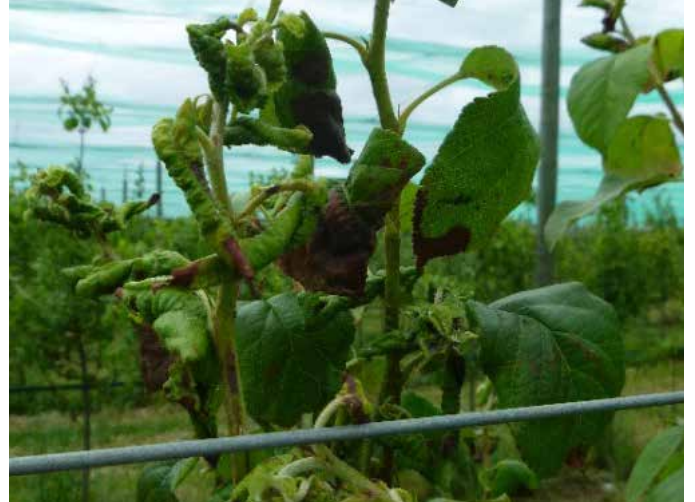
Attaque de pucerons cendrés sur pousse, feuilles enroulées